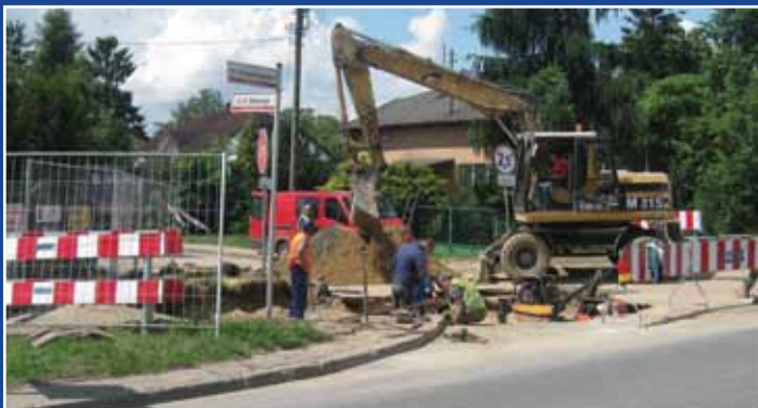
Budowa sieci wodociągowej w ul. Batorego