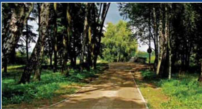
Zrewaloryzowany Park Miejski