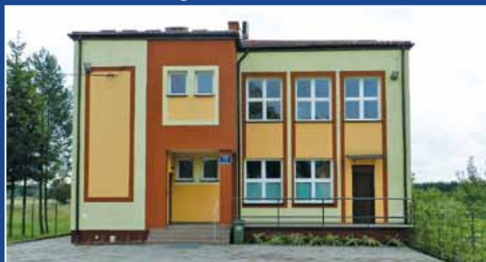
Dom Ludowy w Kopyści