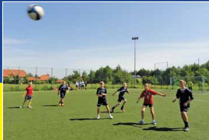
Boisko Orlik przy Szkole Podstawowej nr 5