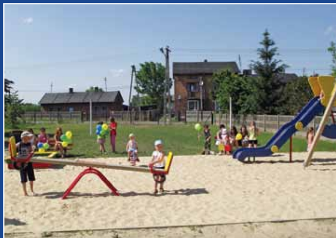
Plac zabaw przy Domu Ludowym w Orchowie