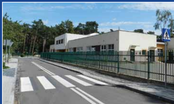
Budynek Przedszkola Publicznego nr 4