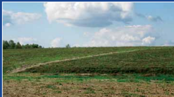
Zrehabilitowany teren składowiska odpadów w Orchowie