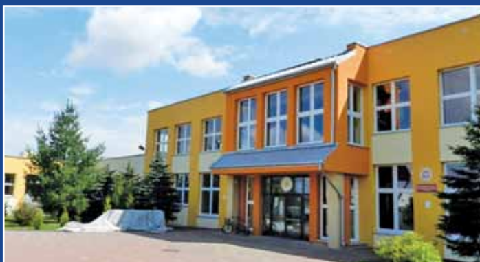
Budynek Szkoły Podstawowej nr 5 po termomodernizacji