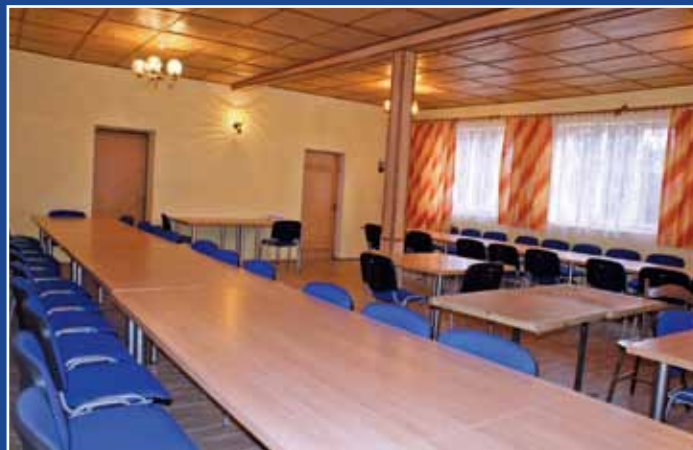
Wnętrze zmodernizowanej Świetlicy Wiejskiej we Wrzeszczewicach