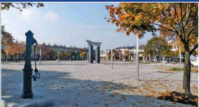
Zrewitalizowany Plac 11 Listopada