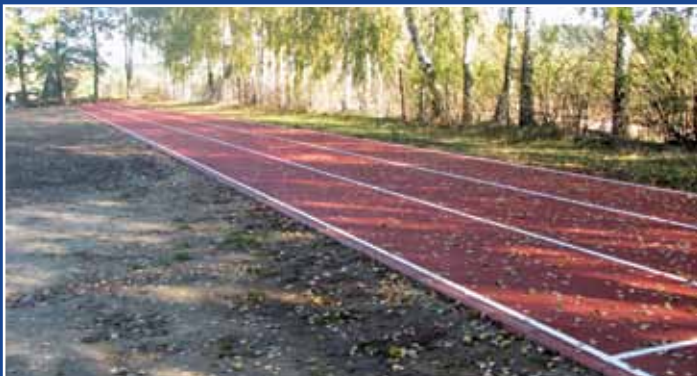
Bieżnia w Teodorach