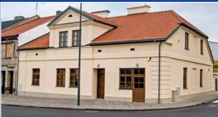
Zrewitalizowana kamienica przy Placu 11 Listopada nr 7