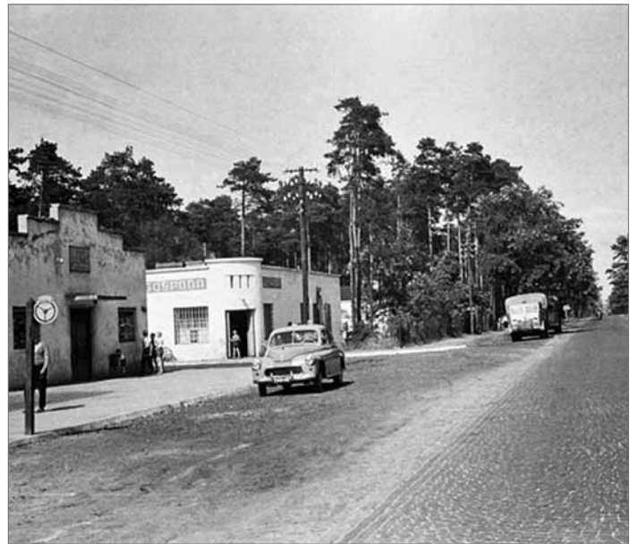
Centrum Kolumny w latach sześćdziesiątych. Łza się w oku kręci...

A że w Kolumnie wypoczywali na ogół ludzie majątni, ściągali tu masowo złodzieje i chuligani, licząc na łatwy łup. W 1938 roku jedna