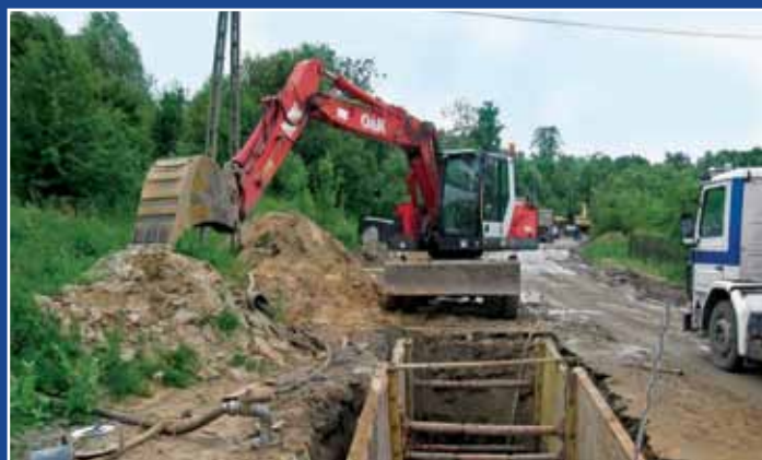
Budowa sieci kanalizacyjnej