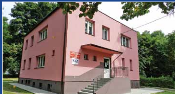
Budynek GPZO we Wrzeszczewicach po termomodernizacji

W ramach zadania w budynku świetlicy wiejskiej we Wrzeszczewicach wykonano przebudowę wewnętrznej instalacji wodociągowej i kanalizacji sanitarnej oraz budowę zewnętrznej instalacji kanalizacji sanitarnej i zbiornika